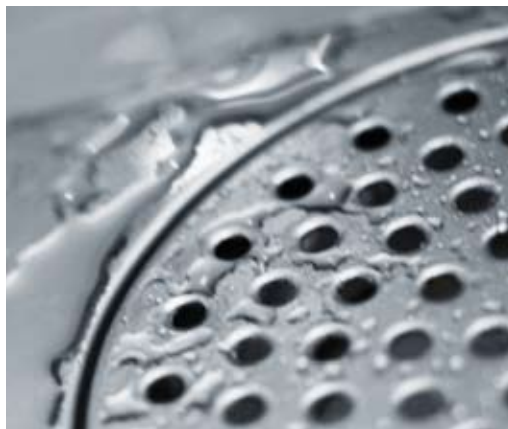
Vattenbrunnar är vanliga platser där du finner silverfisk.