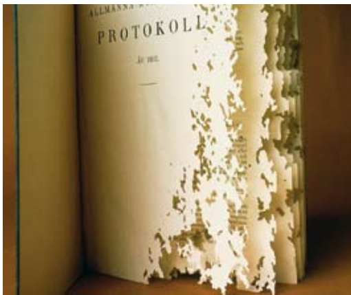
Synliga tecken på resultatet av en silverfisks framfart.