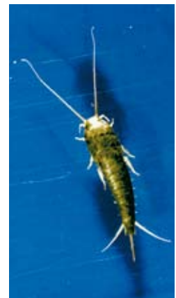
En silverfisk i närbild.

SILVERFISKEN ÄR ALLÄTARE och lever bland annat av de rester som samlas i golvbrunnar och avloppsrör. Favoritfödan är saker som innehåller stärkelse; klister, bokbindningar, socker, hår och mjäll. Den kan ibland göra skada på äldre bokband, papper och